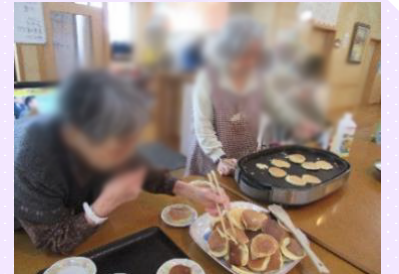
ホットケーキ作り