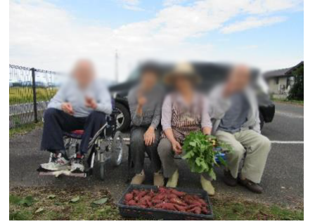
ララ畑にてパチリ